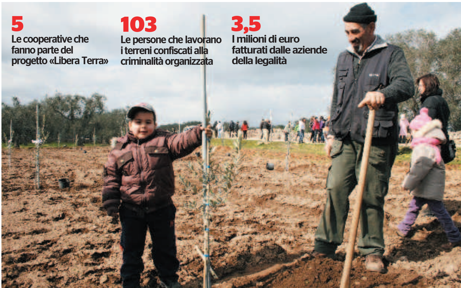
I beni confiscati alla Mafia rischiano di tornare nelle mani di Cosa Nostra

I milioni di euro fatturati dalle aziende della legalità