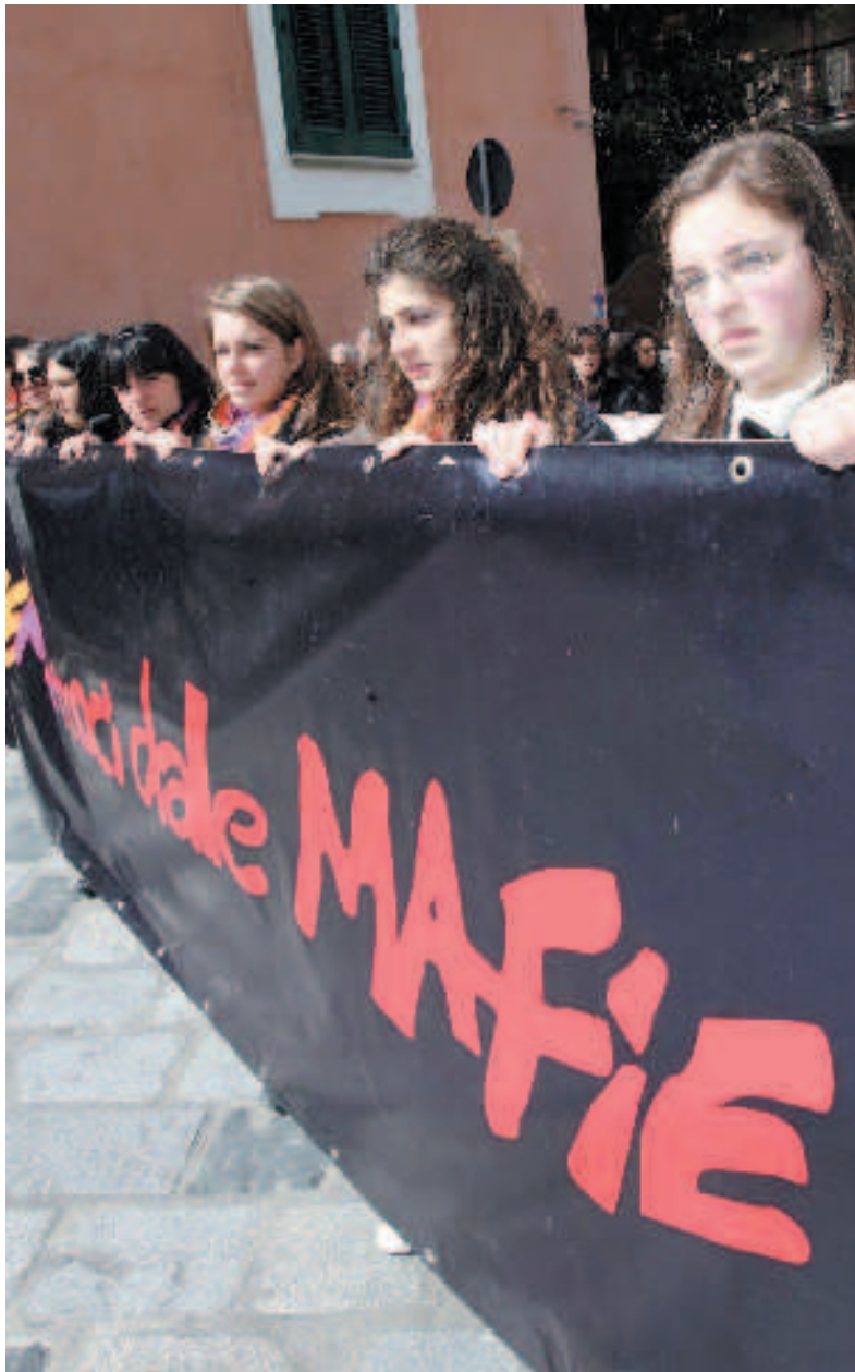
Una interrogazione bipartisan contro la norma che vende i beni mafiosi

Raccolta di firme anche a destra. Si lavora a un emendamento soppressivo che fermi la norma-vergogna che rischia di mandare all'asta i beni confiscati. Intanto gli Enti locali si organizzano: ordini del giorno per fermare la vendita.